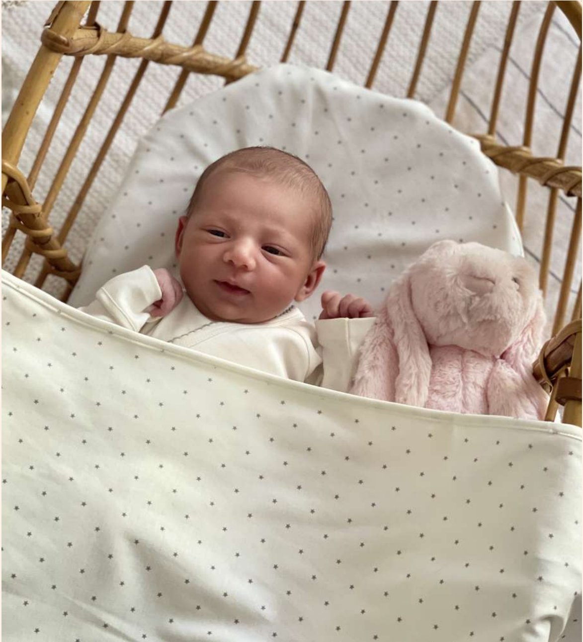
COUVERTURE FINE BÉBÉ BIO. 100% coton bio. Dimension : 80 x 80 cm. 3 déclinaisons possibles (étoiles grises, étoiles bleues, étoiles roses). Réf. = JOSEPHINE